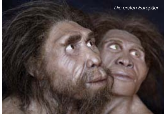
Die ersten Europäer